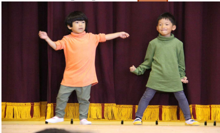
1年生 はじめのことば