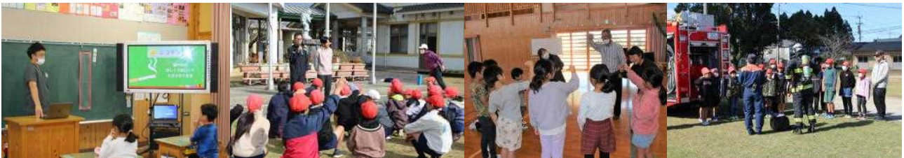
学校薬剤師による薬物乱用防止教室

『歩けば足音がついてくるように 一生懸命生きていれば 幸せもついてくる』(～最近出会った言葉より～先輩からの葉書)を音読して、毎日やる気倍増です。