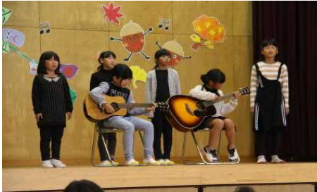
音楽クラブ 紅蓮花 他