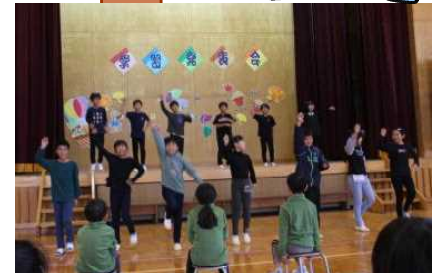
3・4年生劇 ちいちゃんのかげおくり