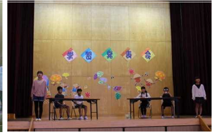
5・6年 笠木TV～農業の今を伝える～