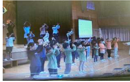
全校発表 世界に一つだけの花