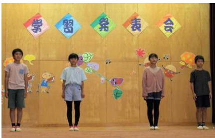
終わりのことば（6年生）

11月5日（日）学習発表会が行われました。今年は、保護者に加え、地域の方々も鑑賞に来てくださいました。運動会が終わってから1ヶ月、授業で学習したことをもとに、アイデアを出しながら作り上げてきました。音楽クラブではギター伴奏にのって歌ったり、全校音楽では歌と手話で表現したりと、例年とは違う取組も行いました。たくさんの方々に観てもらいながら、子供たちは、みんな生き生きと表現していました。